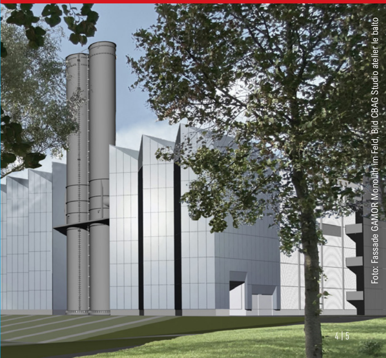
Foto: Fassade GAMOR Monolith im Feld, Bild CBAG Studio atelier le balto

GAMOR und dem zusätzlichen Wärmespeicher sichern wir die Fernwärmeversorgung der Landeshauptstadt und sparen in Saarbrücken gleichzeitig ca. 60.000 t CO 2 im Jahr ein. Durch den Bezug von Fernwärme partizipiert also jeder an der Fernwärme angeschlossene Haushalt automatisch von der Verbesserung der Umweltbilanz beim Heizen. Perspektivisch prüft Energie SaarLorLux die Erzeugung der Saarbrücker Fernwärme durch Erneuerbare Energien auszubauen. Daher sind die GAMOR-Motoren bereits heute dafür ausgelegt, in Zukunft auch zu einem gewissen Anteil Wasserstoff verbrennen zu können. Neben der Erzeugung der Fernwärme in den Heizkraftwerken Römerbrücke bezieht Energie SaarLorLux einen Teil der Fernwärme von der ZF Friedrichshafen (Standort Saarbrücken) und aus Anlagen der Stadtwerke Saarbrücken.